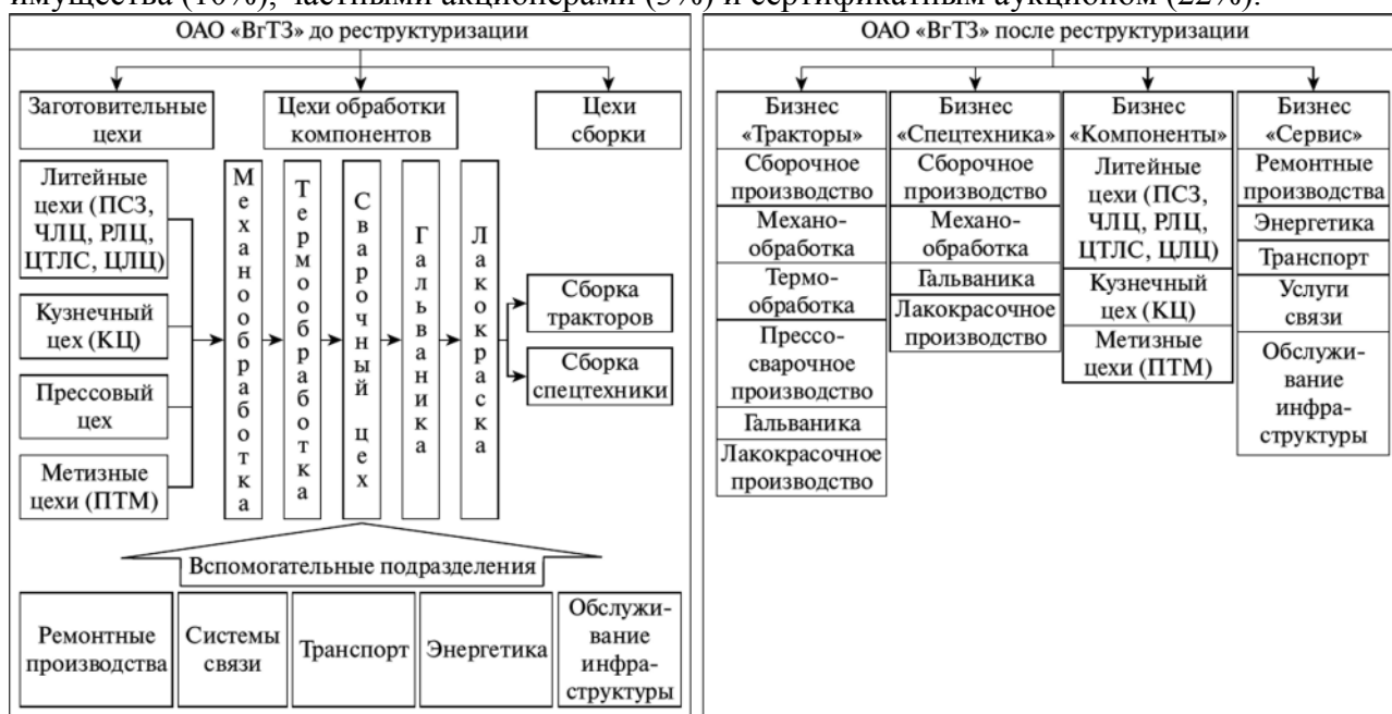
Рис. Структура ОАО «Волгоградский тракторный завод» до и после реструктуризации

Завод сантехнического оборудования был образован как часть строительного объединения в секторе жилищного строительства и отвечал за монтажные услуги. В 1994 году завод был преобразован в открытое акционерное общество на основе отделения от исходного предприятия. Акционерный капитал был распределен между работниками (40%), трастовыми компаниями и инвестиционными фондами (25%), фондом государственного имущества (10%), частными акционерами (3%) и сертификатным аукционом (22%).